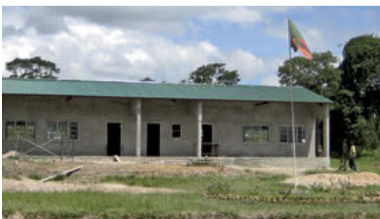
Weiterführende Schule kurz vor der Fertigstellung.

Seit 13 Jahren fördert die Baugenossenschaft Familienheim Heidelberg eG die Projekte der DESWOS als Mitglied und Spender. Über die DESWOS bekräftigen wir unser sozial verantwortliches Handeln. Denn mit dem Mitgliedsbeitrag und den Spenden fördern wir die soziale und wirtschaftliche Entwicklung der Menschen in den Projektländern.