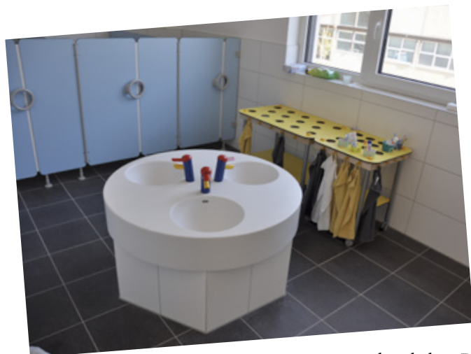
Der Wasorraum in der Kindertagesstätte ist modern und kindgerecht

Neubauprojekt „Horizonte“ in der Mark-Twain-Straße 2-4 ist im Ziel